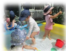
【今年の水遊びの様子】

水遊びが初めてのお友達は、タライの中に手を入れて水の感触を確かめたり、慣れているお友達は、ビニールプールの中に腰を下ろし、バケツやジョウロを使ってじっくり遊んだり、それぞれに笑顔を見せながら過ごしています。暑い日は、ぜひちあふるに来て、水遊びを楽しんでください。水遊びは、8月中旬までの予定です。