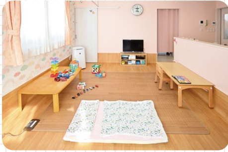
静養室も完備で安心です

病気やケガなどで登園や登校ができないときに、 仕事を休めない保護者に代わって、 看護師や保育士がお子さんの感染症の種類によって部屋を分けてお預かりします！