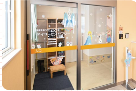
こどもデイサービスセンターの入口(2階)