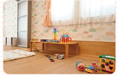
おもちゃもあるのでお子さんも退屈しません