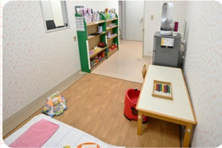
センター内の様子