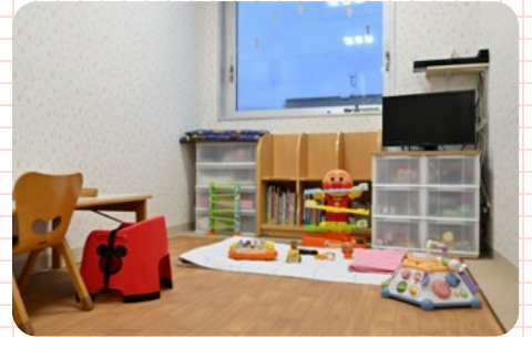
おもちゃもあるのでお子さんも退屈しません