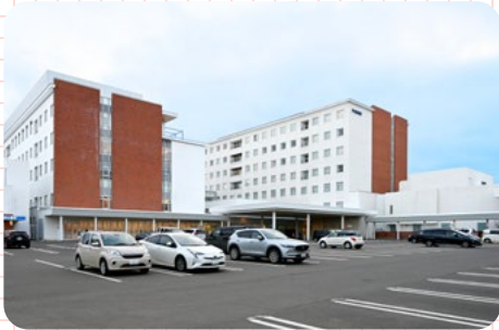
天使病院に付設しています

病気やケガなどで登園や登校ができないときに、 仕事を休めない保護者に代わって、 看護師や保育士がお子さんの感染症の種類によって部屋を分けてお預かりします！