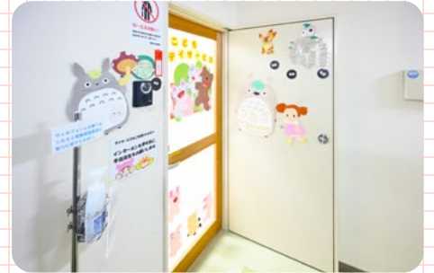
インターホンを鳴らしてからお入りください