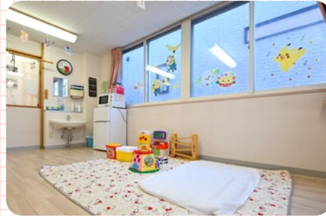
おもちゃもあるのでお子さんも退屈しません