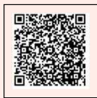
（子どもと歯の健康）