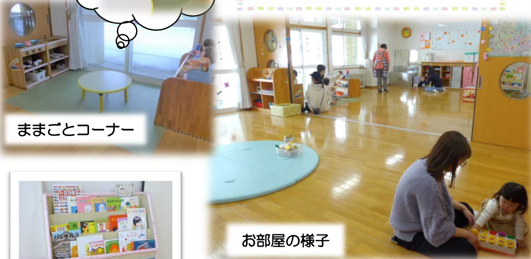
ママごとコーナー