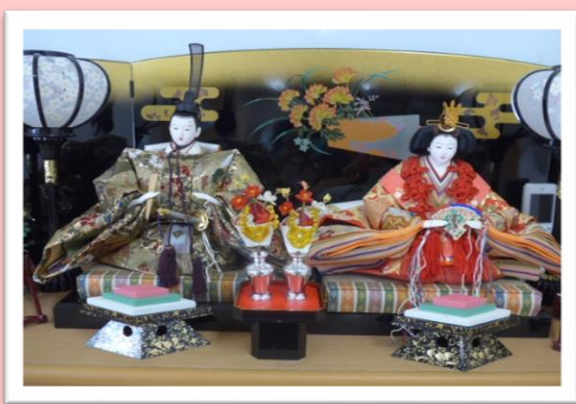
おひさまの部屋にぜひ見に来てください♪

おひさまの部屋でも、ひなまつりの雰囲気を楽しんでいただけるよう、おひなさまとおだいりさまを飾りました。そのほか装飾などもひなまつりのかわいい飾りになっていますので、ぜひ雰囲気を味わいにきてくださいね。